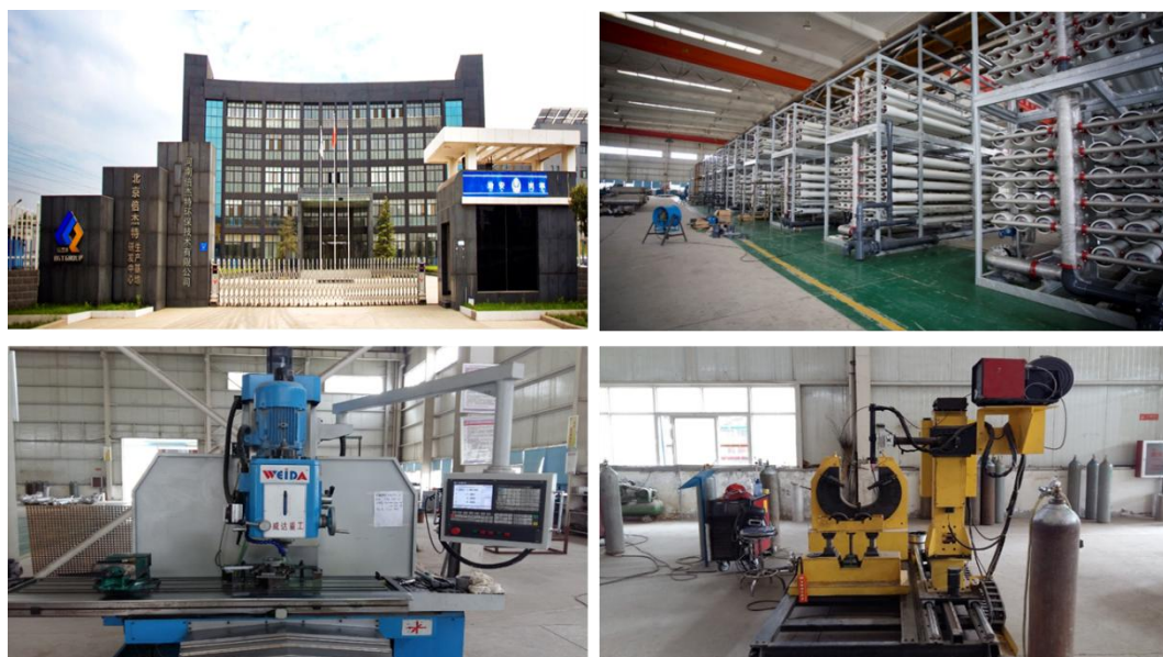
倍杰特生产制造基地